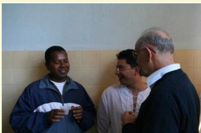
Un malgache, un colombiano y un español