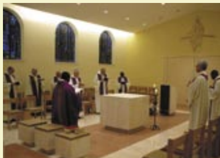
Comunidad de Roma (Italia) en oración