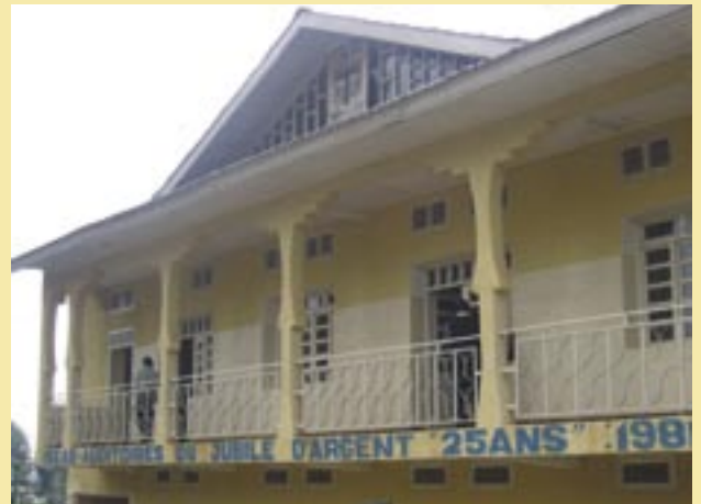
ISEAB, Instituto Superior Emmanuel d'Alzon de Butembo