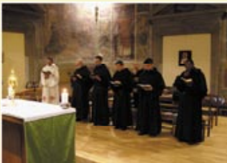
La comunidad de Florencia (Italia) durante la adoración al Santísimo