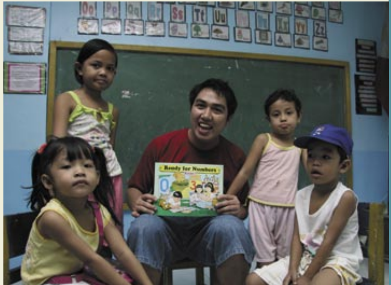
Un joven filipino con algunos niños (Manila)

A bordo de la « Péniche », lugar de acogida de inmigrantes (Francia)