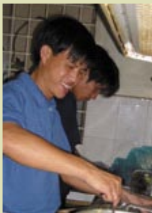
La comunidad de Saigón (Vietnam)

«En un mundo dividido, nuestra vida común testimonia que Cristo está vivo entre nosotros y que realiza nuestra unidad para el anuncio del Evangelio» (Regla de Vida)