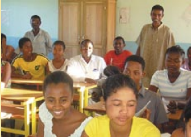
Colegio Monseñor Canonne (Madagascar)