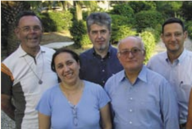
Miembros de la Comisión Internacional Laicos-Religiosos