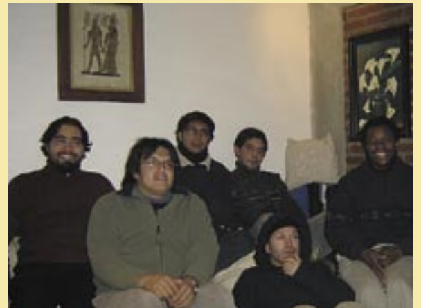
Comunidad de formación en Chile: ¡qué hermosa es nuestra diversidad!