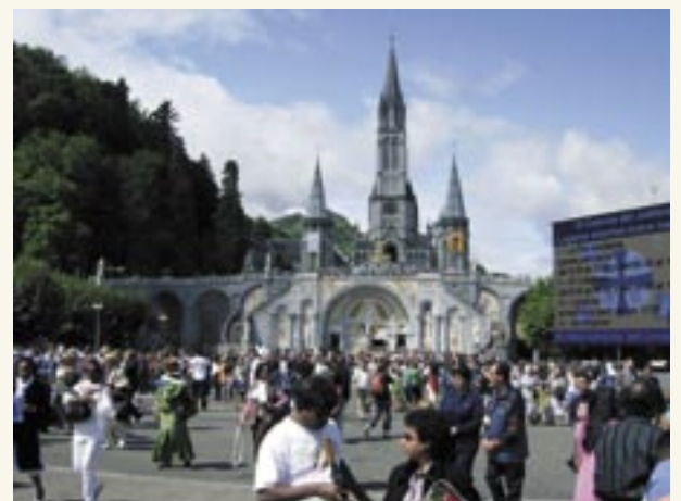
Lourdes durante la Peregrinación Nacional (de Francia)