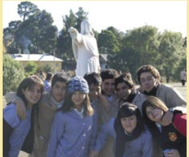
Estudiantes del Colegio de Lota (Chile)

Los Asuncionistas enseñan o animan en centros diversos: dos universidades, Assumption College en EE UU, ISEAB en RD del Congo; una docena de colegios en siete países; escuelas técnicas, primarias, de alfabetización de adultos, etc. Otros son capellanes de estudiantes.