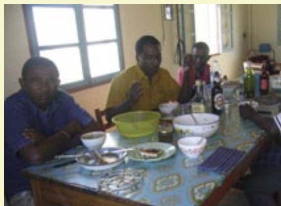
La comunidad de Anakao (Madagascar)

en las comidas, que son para los Asuncionistas ocasión para estrechar los lazos en la sencillez, según el espíritu de familia tradicional en la Asunción.