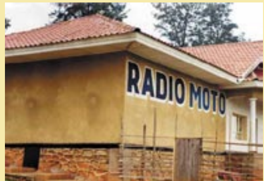
Radio Moto (RD del Congo)

A día de hoy, el grupo Bayard, presente en Francia y con su sección Internacional, es un florón de la prensa católica con, por ejemplo, el diario La Croix, el semanario Pèlerin, la Documentation Catholique, el mensual Prions en Eglise. En la República Democrática del Congo, los Asuncionistas dirigen y gestionan una radio conocida como Radio Moto