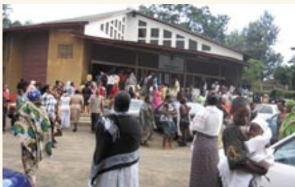
Parroquia de Kijenge, Arusha (Tanzania)

El Padre d'Alzon es nimeño de sangre, pero católico de corazón. Durante casi toda su vida, d'Alzon sirvió a la Iglesia como Vicario General. De la misma manera, muchos Asuncionistas se dedican al servicio de las Iglesias locales.