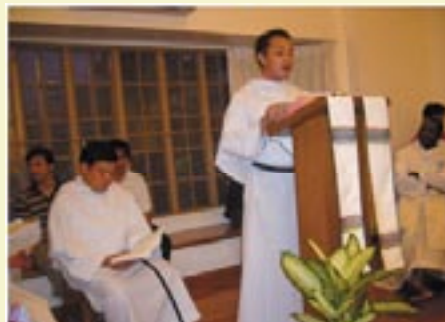
Comunidad de Adveniat House (Filipinas)

La oración es una de las motivaciones que me animaron a entrar en la vida religiosa. En efecto, era consciente de que en casa no tenía suficiente tiempo para dedicarme a la oración.