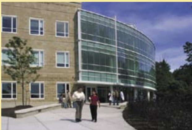
Assumption College, Worcester (Estados Unidos)