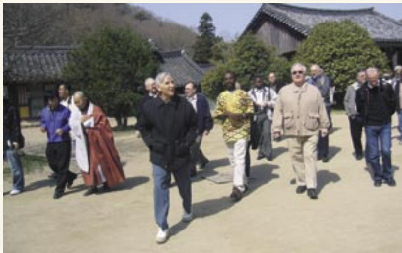
El Consejo de Congregación visita a monjes budistas (Corea del Sur)