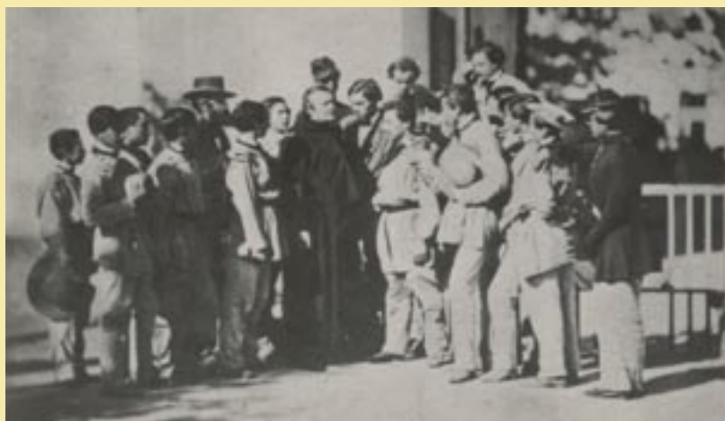
Manuel d'Alzon en medio de sus alumnos en el Colegio de Nimes (Francia)