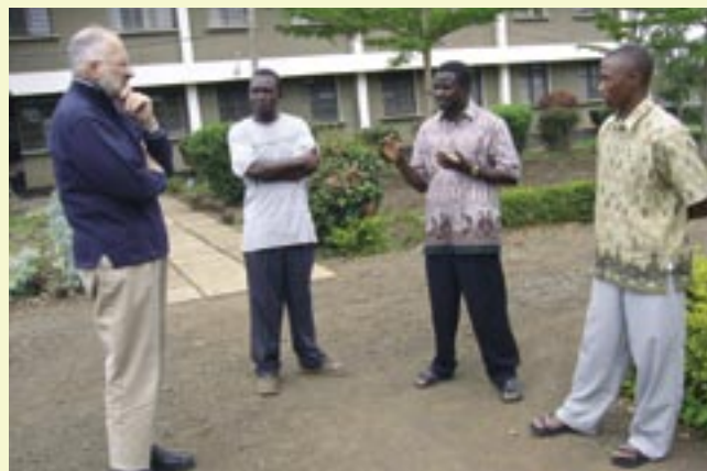
Comunidad de Austin House (Tanzania)