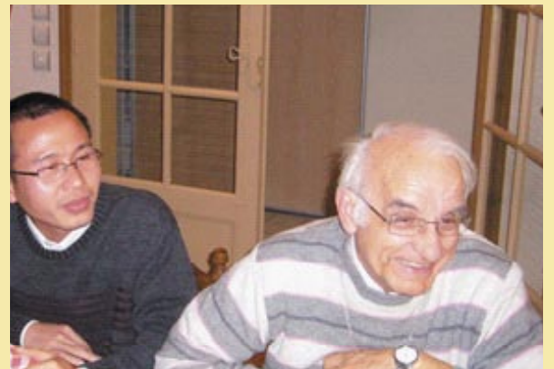
Noviciado de Juvisy (Francia)