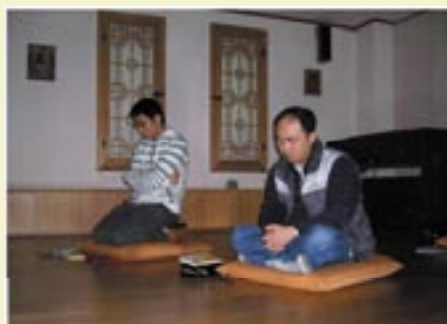
Comunidad de Gwangju (Corea)