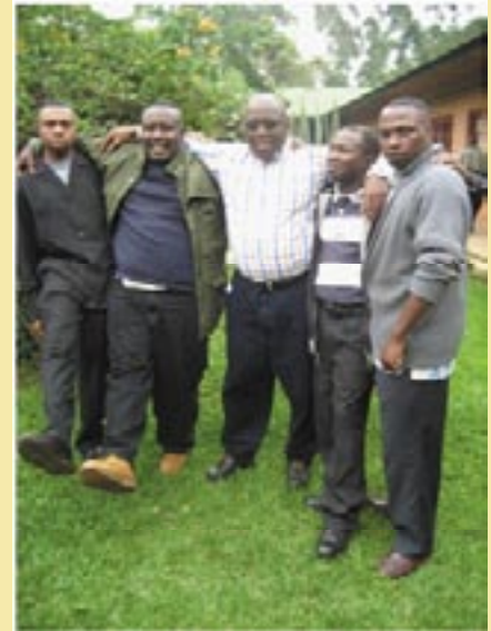
Jóvenes sacerdotes asuncionistas (Bulengera, RD del Congo)

Su secreto: sencillez, humildad, franqueza, transparencia, apertura de espíritu, cordialidad.