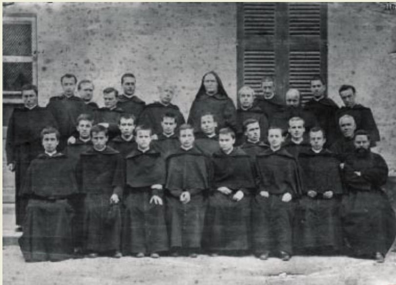
La primera generación en torno al Padre d'Alzon (1879)

La gran preocupación del Padre d'Alzon será entonces devolverle a Dios sus derechos. Esta pasión por Dios le impulsará a fundar una Congregación. Desde sus orígenes, la razón de ser de la Asunción es el amor a Dios, lo que d'Alzon llama el Advenimiento del Reino de Dios (A.R.T.)