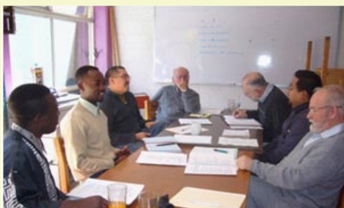
La comunidad de Casa Manuel (México)

En un espíritu de apertura y de franqueza, todos son responsables de la buena marcha de la comunidad.