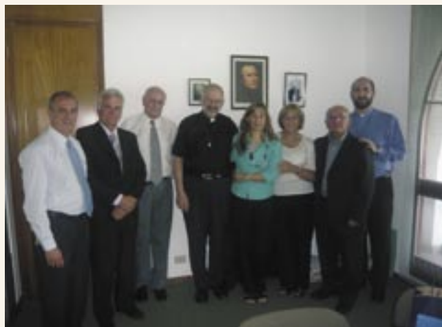
Laicos y religiosos de Buenos Aires (Argentina) durante una de las visitas canónicas

Junto con el Padre d'Alzon y los religiosos asuncionistas, los laicos han tratado de restituir su lugar en la sociedad a Jesucristo, y a quienes él más amó: la Iglesia y la Virgen. En el colegio de Nimes, cuna de la Asunción, a laicos y religiosos les movía el mismo deseo: el Reino de Dios.