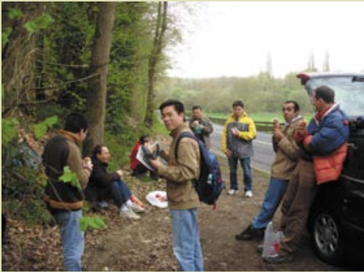
Novicios de paseo (Francia)

En la Asunción, sacerdotes y no sacerdotes, jóvenes y mayores, negros y blancos, todos son hermanos y aprenden de Cristo según el espíritu de San Agustín, sea cual sea su edad, su cultura, su raza, sus orígenes. Juntos disciernen los medios para responder a los retos del mundo. Sí, su pasión por el Reino de Dios transforma sus diversidades culturales en riqueza.