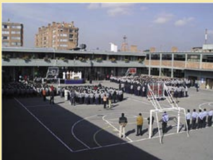
Colegio Emmanuel d'Alzon (Colombia)