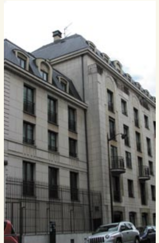
Albergue Juvenil, París