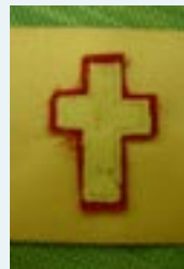
Cruz blanca sobre lana roja de los peregrinos de Notre Dame de Salut.

5/ En respuesta a una solicitud del Papa Pío IX, para que se ocupe de los Búlgaros que desean abrazar el catolicismo, crea la "Misión de Oriente", y en 1865 funda la congregación de las Oblatas de la Asunción para que secunden a los religiosos en esa obra.