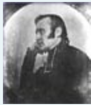
El joven Abate d'Alzon

1/ La dorada juventud de un joven rico que decide abandonarlo todo para consagrar su vida a Cristo y a la Iglesia.