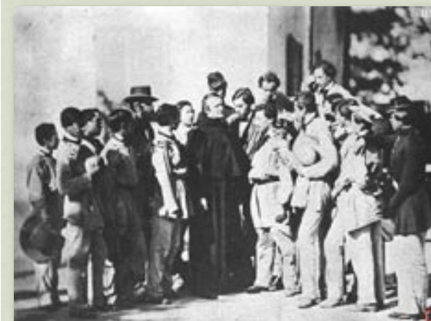
El Padre d'Alzon con los alumnos de la Asunción

Fundador de los Agustinos de la Asunción (1845) y de las Oblatas de la Asunción (1865) Vicario General de Nimes durante casi 40 años.