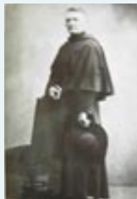
Con el sombrero romano, como buen ultramontano.