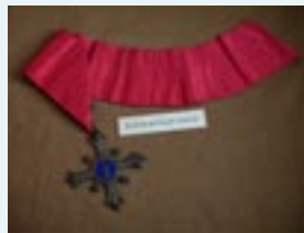
Su cruz de Vicario General