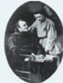
Con un alumno del colegio

3/ Se hace cargo de la casa de la Asunción, un internado para el que consigue libertad de enseñanza, y donde funda los Agustinos de la Asunción en la Navidad de 1845.