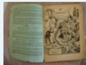
1er Almanaque del Pèlerin 1879

4/ Con los primeros Asuncionistas, emprende un apostolado popular a través de peregrinaciones, prensa e iniciativas de acción social.