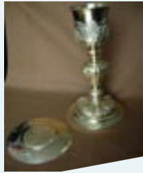
Cáliz, regalo de su padre

2/ Al servicio de la diócesis de Nimes, se entrega a una actividad desbordante y emprende un gran número de obras.