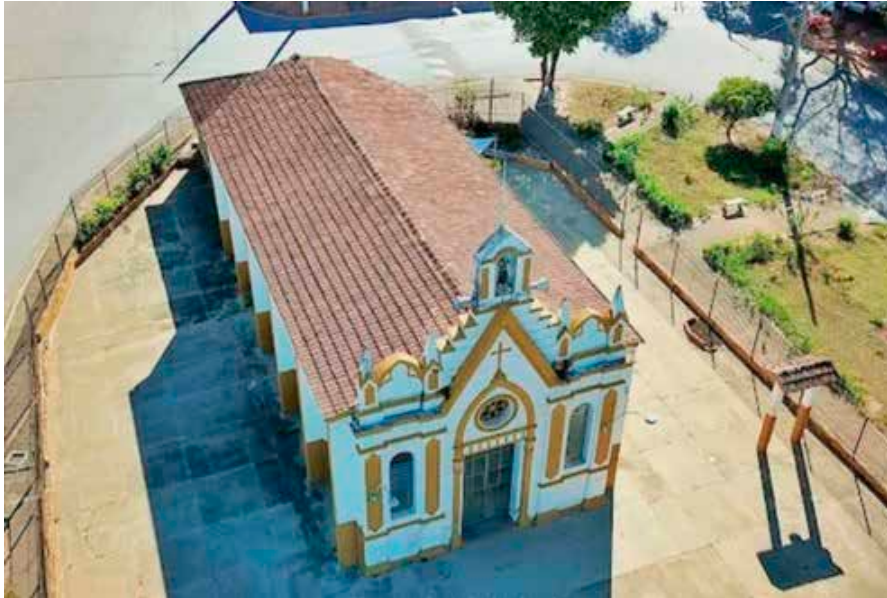
Una de las iglesias de la parroquia de Pará de Minas

Hacía mucho tiempo que no se veía tal «avalancha» de nuevas comunidades aprobadas en un solo CGP... sin ningún cierre por otra parte.