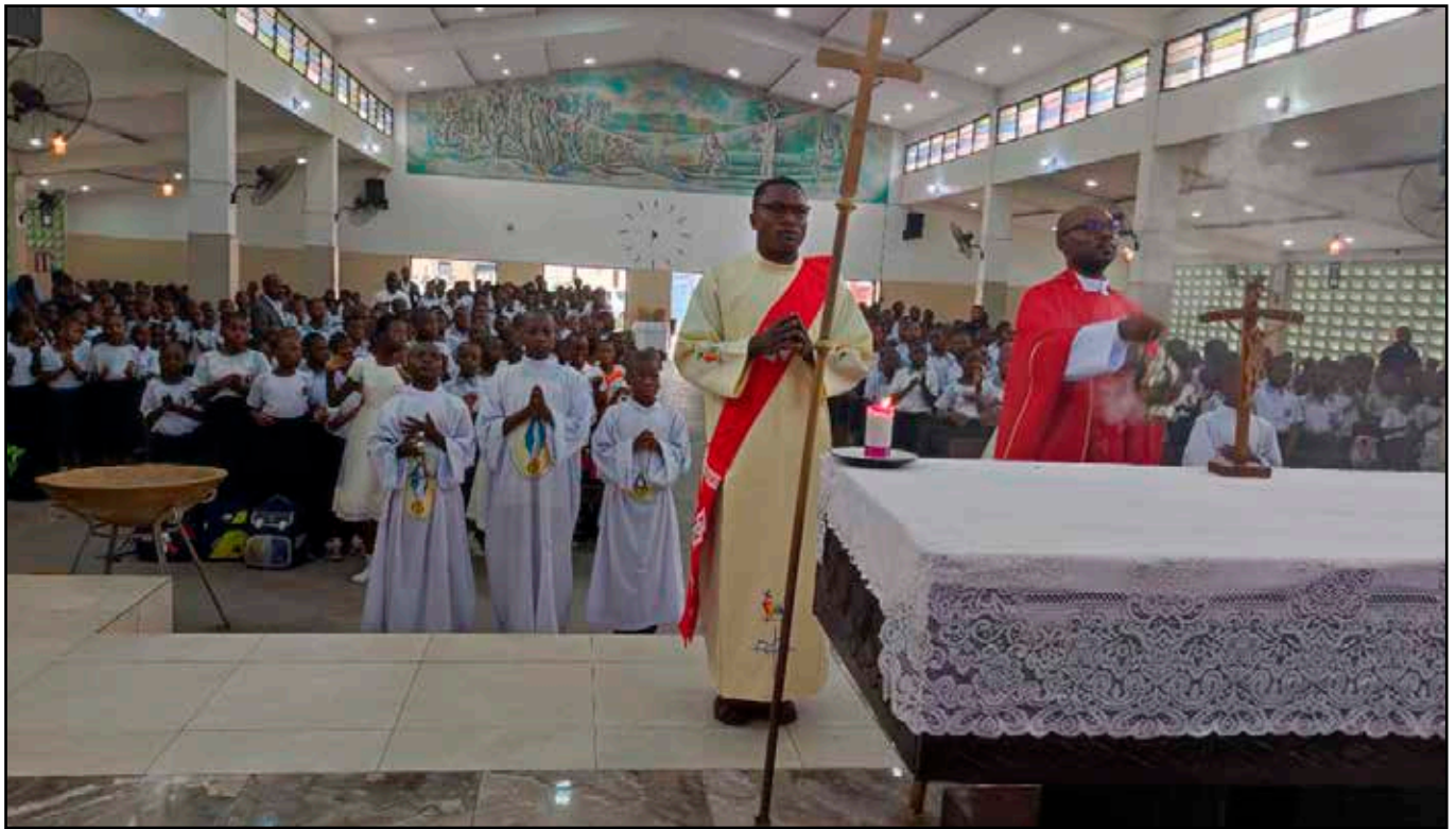
Celebración de la misa de ingreso oficial de los alumnos del complejo Emmanuel d'Alzon I

hermanos se organizan en grupos de vida, con celebraciones, el compartir e intercambios en su seno. La escucha, la comprensión y la acogida mutua cultivan la fraternidad teñida de interculturalidad e internacionalidad, tanto en esta comunidad como en todo el Vicariato.