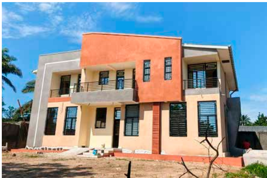
La futura casa comunitaria de Kimbondo (República Democrática del Congo).