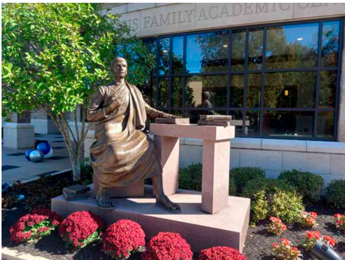
San Agustín. Estatua de bronce en el campus de la Universidad de la Asunción en Worcester (EE. UU.).

¿Q ué tienen en común Emmanuel d'Alzon y el papa León XIV? Ambos citan abundantemente a san Agustín. Es una oportunidad para replantearnos la influencia de este último sobre nuestro Fundador, pero también su proximidad con quien podría decidir algún día su beatificación.