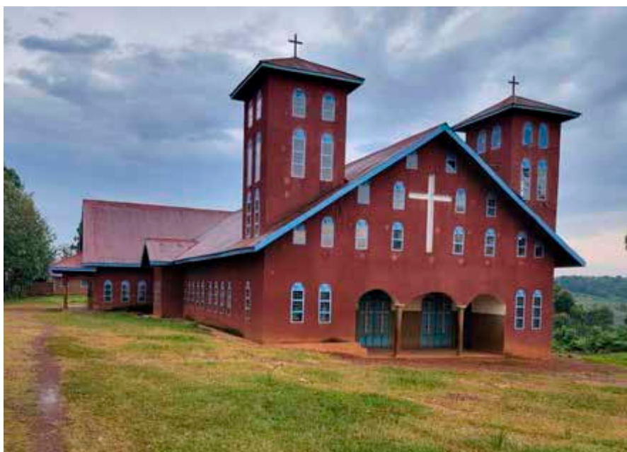
La iglesia dedicada a la Asunción en Muhila (República Democrática del Congo).

Se prevé la presencia de tres religiosos: dos dedicados al servicio de capellanía para los trabajadores, con una estrategia de animación pastoral aún por definir, y un profesor en la escuela secundaria. Podrán implicarse en la pastoral parroquial, así como en la autofinanciación gracias a las actividades de jardinería. También será necesario equipar progresivamente la capilla y otras dependencias comunes. ■