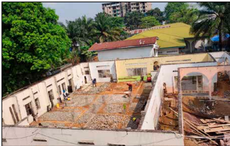
Edificio en construcción en Ngaliema

La misión se amplió más allá de la formación en 1997, cuando la Asunción se hizo cargo de la parroquia del Divino Maestro, en