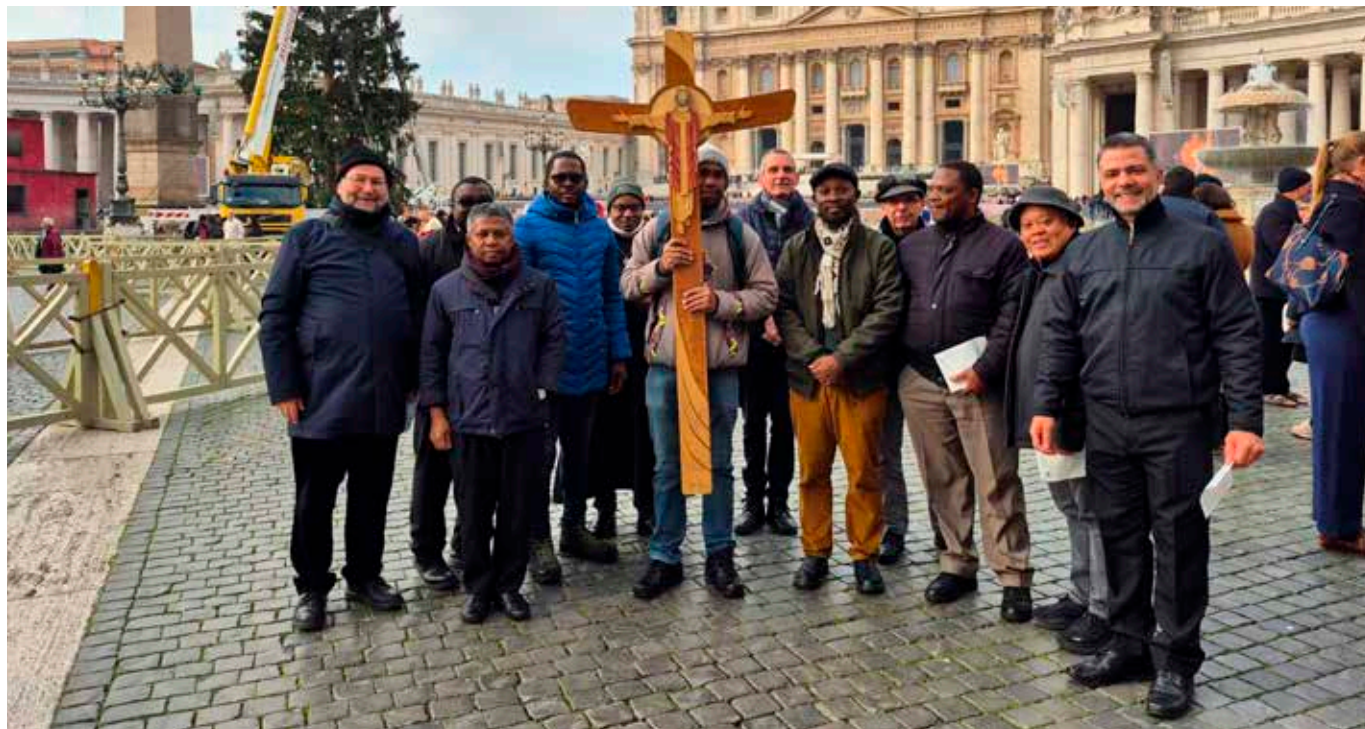
La comunidad general en peregrinación hacia la Puerta Santa de la basílica de San Pedro, en Roma