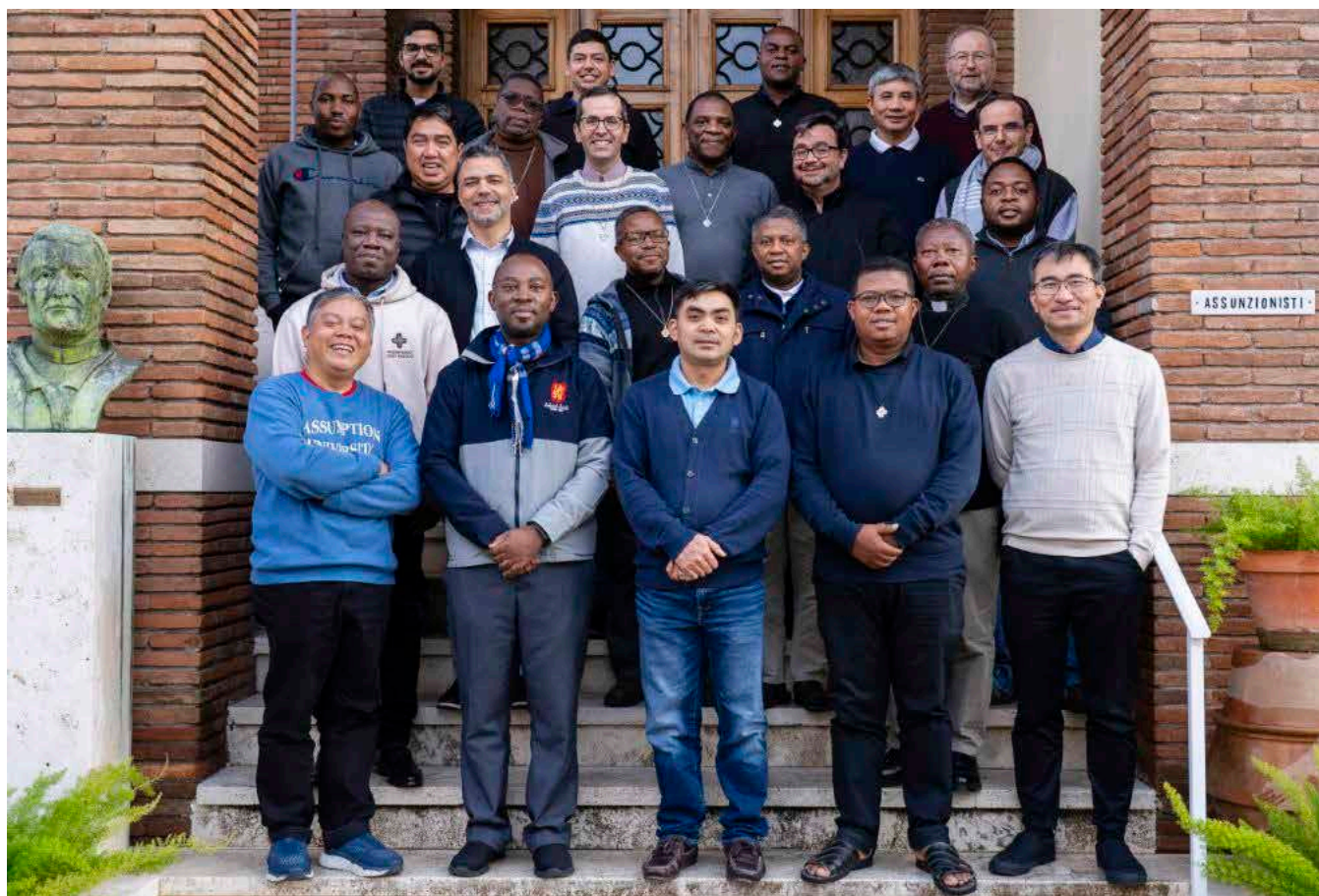
▲ El CGP reunido en Roma con el CEC.

La 5ª sesión del Consejo General Plenario, celebrada en Roma a principios de diciembre, se ocupó de las entidades que van a cambiar de estatuto y de las situaciones de fragilidad en la Congregación... al tiempo que acogió la gracia de nuevas fundaciones.