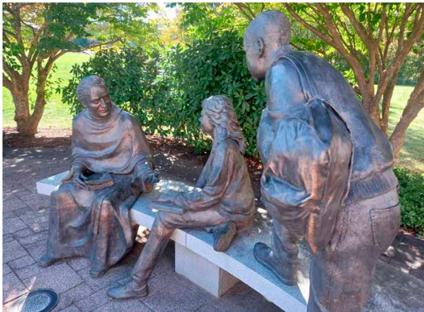
El P. d'Alzon con estudiantes. Estatua de bronce en el campus de la Universidad de la Asunción en Worcester (EE. UU.).

buenos aquellos que se separan del universo en cualquier parte del universo 20 ».