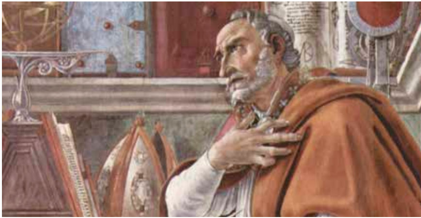
Saint Augustin dans son cabinet de travail, fresque de S. Botticelli, vers 1480 (Florence, église Ognissanti).