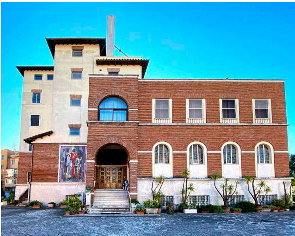
L'actuelle Maison Généralice, via San Pio V

« Ai-je remercié Dieu avec assez de reconnaissance de m'avoir fait fils de l'Eglise catholique ? » ( Directoire , chapitre 1)