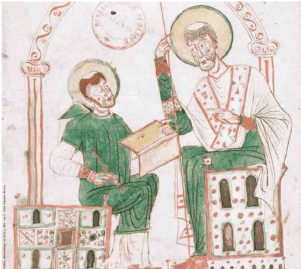
« Saint Augustin dictant », enluminure d'un manuscrit des Enarrationes in Psalmos du 9e siècle (Médiathèque d'Orléans).

nienne avait été déjà bien amorcée, puisque les 12 volumes de la première série consacrée aux Opuscles – selon le plan général de l'édition complète, que l'on trouve dans le premier volume de la collection – étaient tous parus à un rythme rapide avant 1952. La traduction du De Trinitate (BA 15-16) fut également publiée dès 1955. Sous l'impulsion du P. Folliet, ces publications se poursuivirent à un bon rythme et revêtirent peu à peu un caractère plus scientifique : les cinq volumes de la Cité de Dieu (BA 33-37) parurent en 1959-1960 ; en 1962, ce fut le tour des Confessions (BA 13-14), etc.