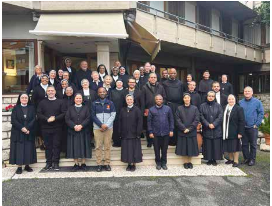
Les Conseils des instituts augustiniens, réunis à Rome.

A un niveau plus large, l'Assomption a participé à la rencontre des Conseils généraux et provinciaux de la famille augustinienne organisée à Rome les 31 janvier 1 er février derniers. Quarante membres des conseils d'une dizaine d'instituts se sont retrouvés à la maison généralice de l'Institut du Divin Amour pour développer leur connaissance mutuelle, renforcer le lien entre eux, se soutenir pour promouvoir l'héritage spirituel commun reçu de saint Augustin. C'était aussi une occasion de vivre lors de la rencontre et de s'encourager à le vivre au quotidien, selon ce qui est dit dans la règle de saint Augustin (n. 2) : « Avant tout, vivez unanimes à la maison, ayant une seule âme et un seul cœur tournés vers Dieu. N'est-ce pas la raison même de votre rassemblement ? » Avant même de parler des œuvres et des activités, la famille