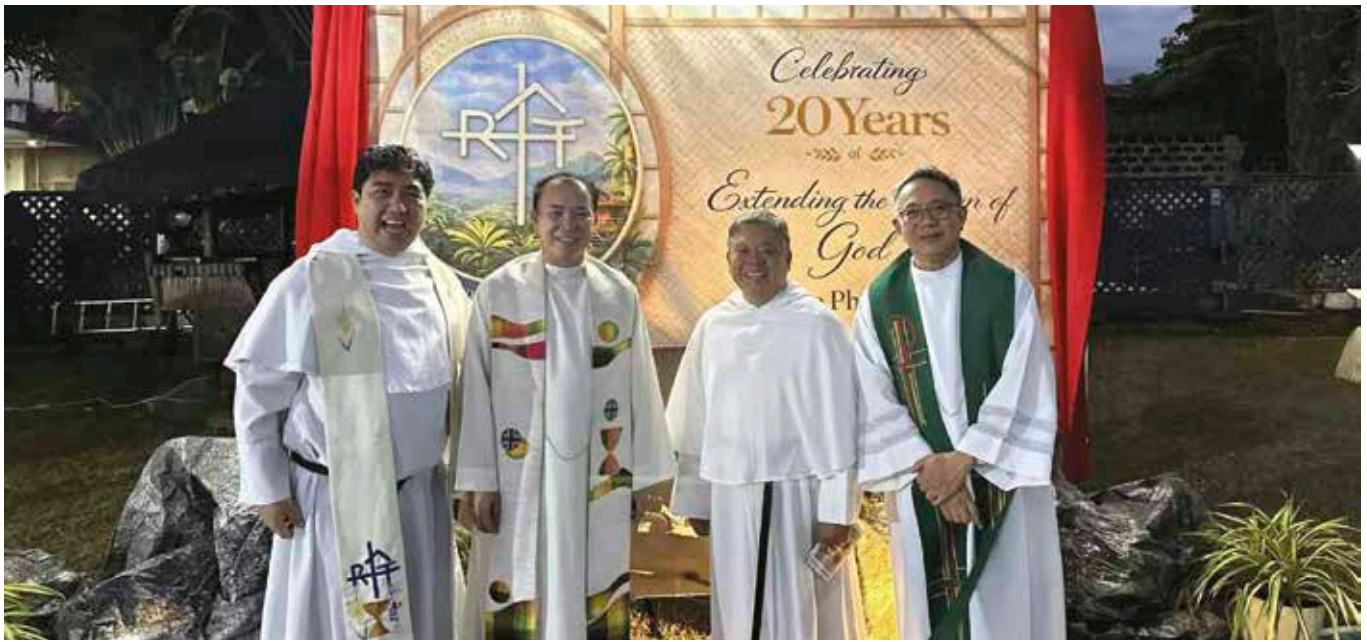
Célébration du 20e anniversaire de la mission aux Philippines, en janvier 2006 à Manille, avec les premiers assumptionnistes originaires de ce pays.