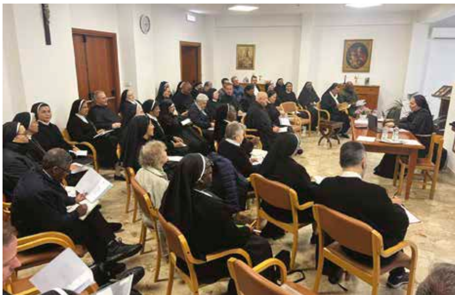
La famille augustinienne réunie à Rome les 31 janvier et 1er février derniers.