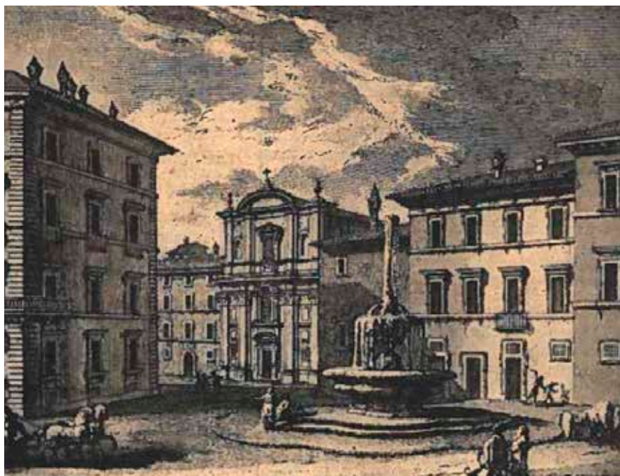
Le palais Filippini à droite et l'église Saint Venance