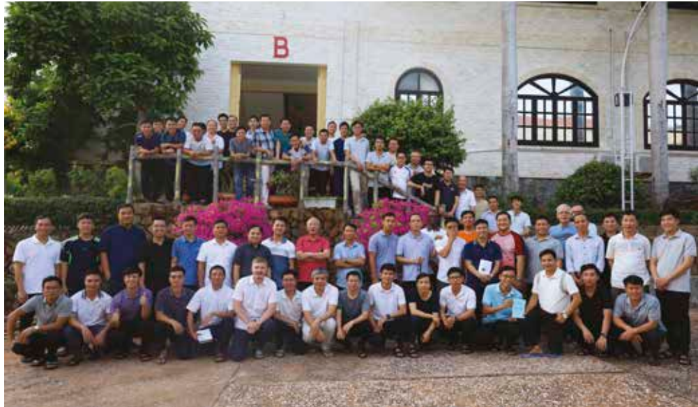
Session assomptionniste annuelle du Vietnam, en août 2024 à Vung Tau.