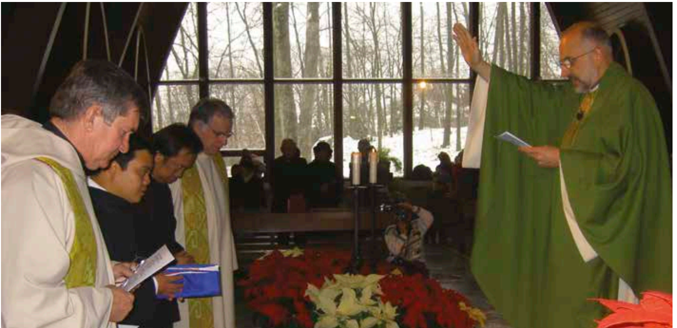
Célébration d'envoi en mission aux Philippines par la Province d'Amérique du Nord, en 2006 à Worcester.